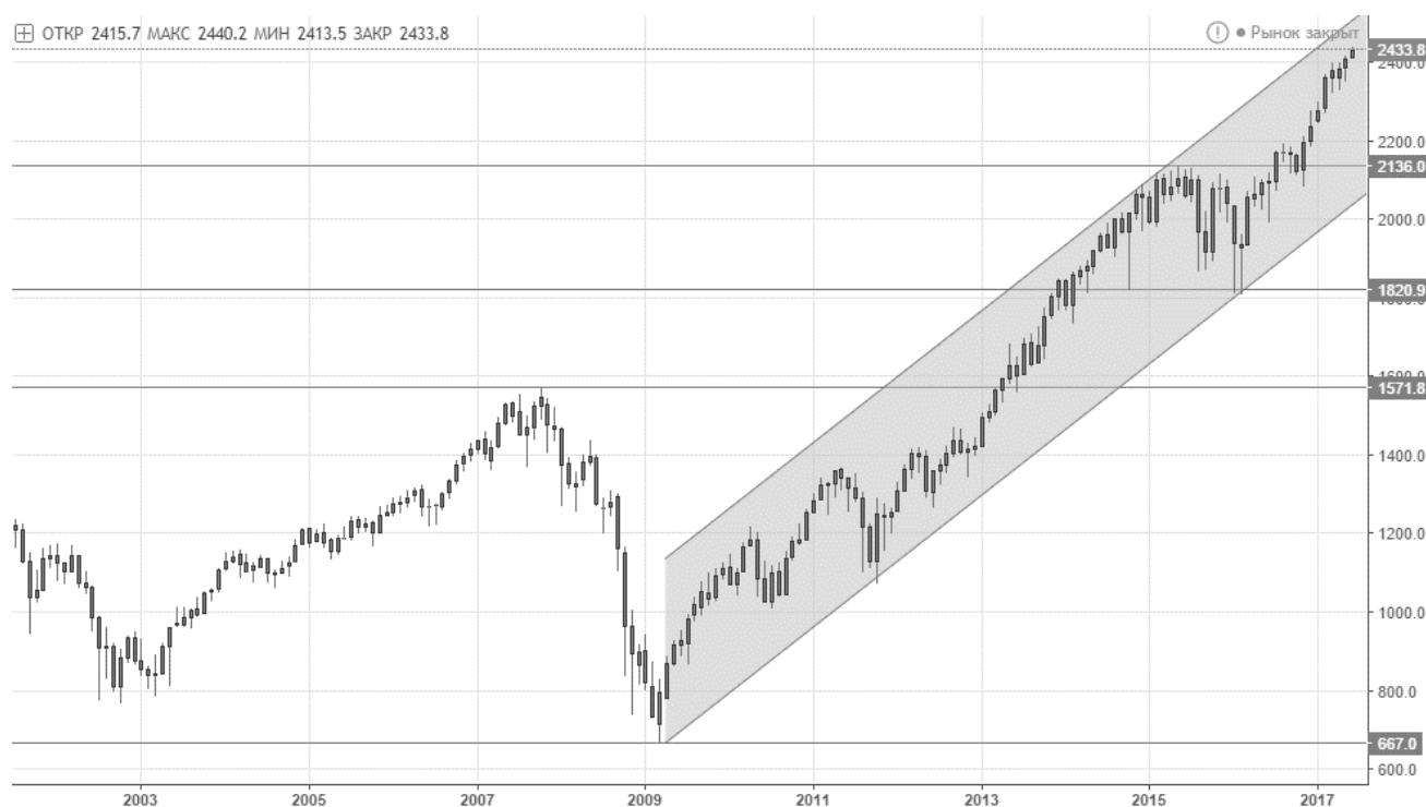
Рис. 1. Технический анализ фондового индекса S&P500 [5].

Кроме того, любопытный рост S&P500 с ноября 2016 года объясняется таким фактором, как победа Д. Трампа на президентских выборах США. Согласно его предвыборной кампании, ожидаются радикальные реформы в области налогового кодекса, модернизации инфраструктуры и введение протекционизма против китайских товаров. Но, все эти ожидания не подтверждены, более того, фундаментально такие реформы маловероятны, хотя участники рынка считают иначе, приобретая все новые и новые акции, и повышая при этом котировки основного индикатора рынка – индекса S&P500.