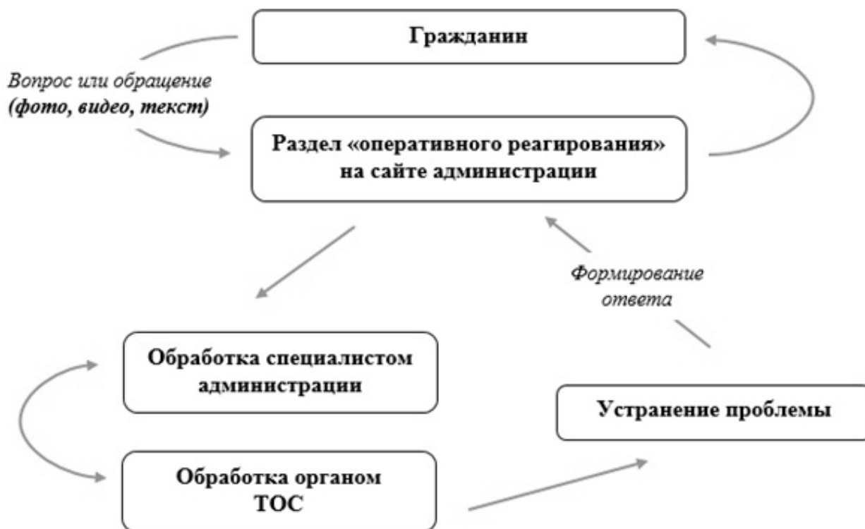
Рис. 1 - Схема взаимодействия администрации района с органом ТОС

Организационная схема работы раздела показана на рис. 1.