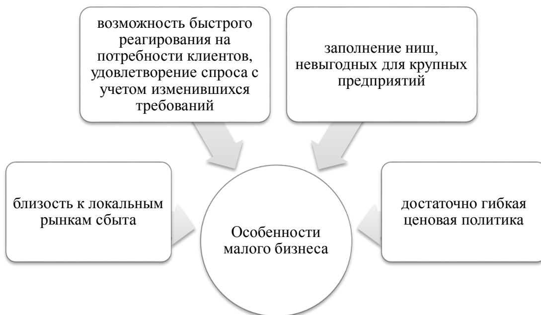
Рис. 1 – Особенности малого бизнеса [1, с.778]

Функционирование малых предприятий имеет ряд преимуществ, таких как малая серийность производства, с умеренными эксплуатационными и накладными расходами, а также способность быстро реагировать на волатильность рыночной конъюнктуры, менять товарный ассортимент в зависимости от изменения потребительских предпочтений, обновлять технологические процессы.