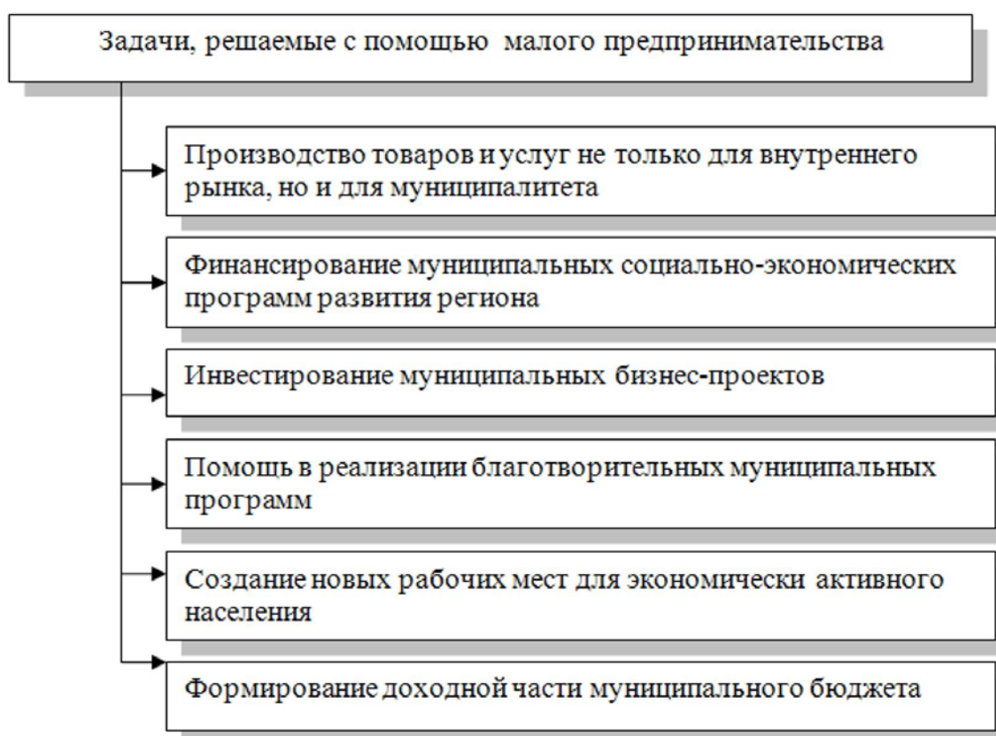
Рис. 2 - Задачи, решаемые с помощью малого предпринимательства на уровне муниципалитета [3, с.178]

С помощью малых предприятий органы местного самоуправления решают ряд задач (рис. 2).