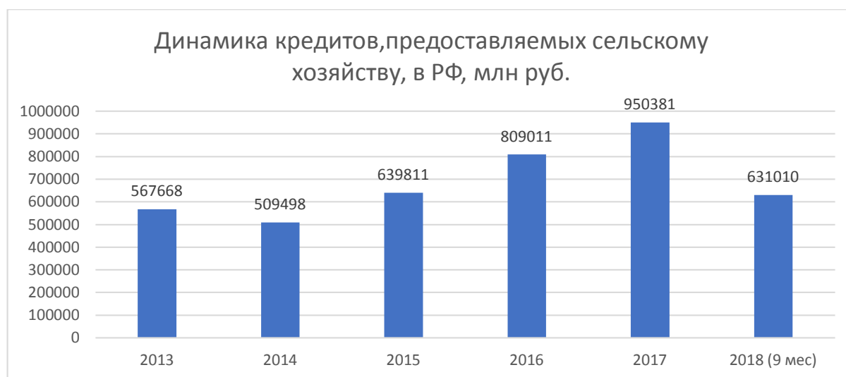
Рисунок 2 – Динамика кредитов, предоставляемых сельскому хозяйству, в России, млн руб.

На 31 декабря 2017 г. объем кредитов, предоставляемых коммерческими банками сельскому хозяйству, составлял, по данным ЦБ России, 950 381 млн руб., что на 67% больше аналогичного показателя 2013 года, а его удельный вес в общем объеме предоставляемых банковским сектором кредитов находился на уровне 3 %, увеличившись на 1%. В течение рассматриваемого периода наблюдается разнонаправленная динамика объема кредитования аграрного сектора страны. Существенное сокращение объема предоставляемых сельскому хозяйству кредитов происходило в 2014 г. в результате ухудшения внешнеполитических обстановки, и как следствие введения со стороны отдельных государств антироссийских санкций - на 11%, а в остальные годы отмечался рост объема предоставляемых кредитов [4].