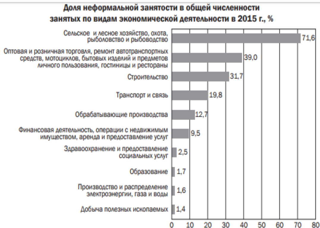
Рис. 4- Доля неформальной занятости по отраслям, 2015г., % [6]

Борьба с теневым сектором экономики представляет собой сложную задачу. Для действенной борьбы с теневой экономикой необходимо разработать и провести такую анти теневую политику, которая, в общем и целом должна сводиться к следующему[6]: