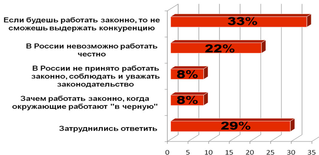
Рис. 3 – Причины ведения бизнеса в РФ с нарушением законодательства [9]

предпринимательства и торговли Кировской области, 33% россиян считают, что в России невозможно выдержать конкуренцию, если работать законно и 22 % считают, что работать честно невозможно, 29% - затруднились ответить. (см.рисунок 3)