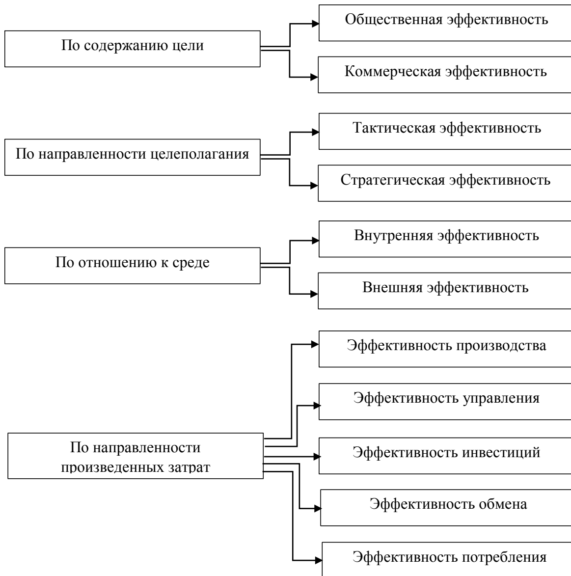
Рисунок 1 – Классификация видов эффективности

С экономической точки зрения банк представляет собой денежно-кредитный институт, осуществляющий регулирование денежного (платежного) оборота в наличной и безналичной форме. При такой характеристике сущности банка он является не просто как экономическим субъектом, но и финансовым институтом, деятельность которого тесно связана и с его собственными коммерческими интересами, и с интересами общества.