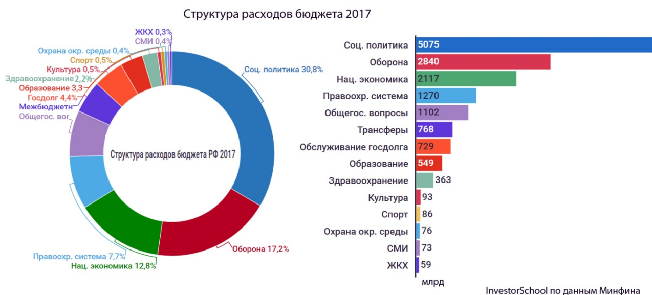
Рис. 3 – Структура расходов бюджета РФ за 2017 год (млрд.руб.)

Для достижения экономического роста по первому пути, как из множества вариантов, необходимо рациональное распределение федерального бюджета. Так как, исходя из данных Министерства финансов (рисунок 3), значительная часть денежных средств направлена на оборону (2840 млрд. рублей), когда на образование и здравоохранение выделили 549 млрд. рублей и 363 млрд. рублей соответственно.