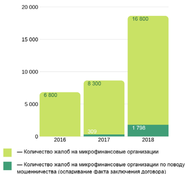
Рис.1 – Количество жалоб на микрофинансовые организации за 2016г., 2017г. и 2018г.

Сегодня Банк России отмечает рост жалоб на МФО. За 2018 год поступило 16,8 тыс., что на 32,8% больше по сравнению с предыдущим годом, доля жалоб по поводу мошенничества (оспаривание факта заключения договора) составила 10,7%, в 2017 году в ЦБ РФ сообщили о 309 жалобах клиентов МФО на данную проблему (4% от всех 8,3 тыс. поступивших жалоб на МФО), в 2016 г. за тот же период было 6,8 тыс. жалоб на МФО, но на утечку персональных данных – ни одной (рис. 1) [4]. Такая динамика связана с сопоставимым увеличением объема выдачи микрозаймов на 47,44% в 2018 по сравнению с 2017 годом. На рисунке 2 видно, что количество займов, в том числе выданных онлайн, ежегодно растет. Доля онлайн-микрозаймов во 2 кв. 2016 г. в общей величине портфеля составила 10,9%, в 2017 г. – 18,93%, в 2018 г. – 27,91% [5]. Таким образом, можно проследить рост как суммы онлайн-микрозаймов, так и случаев мошенничества.