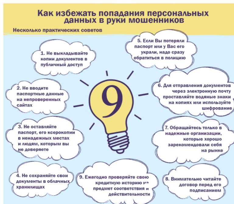
Рис. 3 – Как избежать попадания персональных данных в руки мошенников

Одним из наиболее предпочтительных вариантов решения сложившейся проблемы является использование уже существующей Единой системы идентификации и аутентификации (ЕСИА). Сейчас данную систему используют единицы. Интеграция с ЕСИА и идентификация в ней клиентов МФО – это простой и удобный способ регистрации заемщиков, который упрощает и сокращает по времени процедуру оценки клиента. Данный метод имеет ряд преимуществ, во-первых, это дополнительный канал привлечения клиентов. Во-вторых, соблюдаются требования ЦБ РФ по Федеральному закону от 07.08.2001 №115-ФЗ (ред. от 23.04.2018) «О противодействии легализации (отмыванию) доходов, полученных преступным путем, и финансированию терроризма». В-третьих, предложенный метод идентификации удобен для клиентов, привыкших к цифровым финансовым сервисам. В-четвертых, организации пользуются данными из официальных источников, что позволяет облегчить процедуру проверки, уменьшить время обработки заявки. Существует и ряд недостатков, так, например, прежде чем взять заем, клиенту необходимо пройти регистрацию в ЕСИА, это потребует