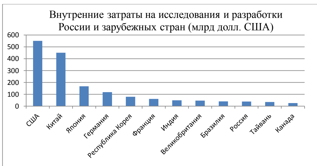
Рис. 2 - Внутренние затраты на науку по странам 2018 год

Так в сфере образования, в периоде получения специальности необходимо делать упор на взаимосвязь теории и практики. Предметы, изучаемые в вузе, уже с первого курса обучения должны быть привязаны к специфике будущей профессии студента.