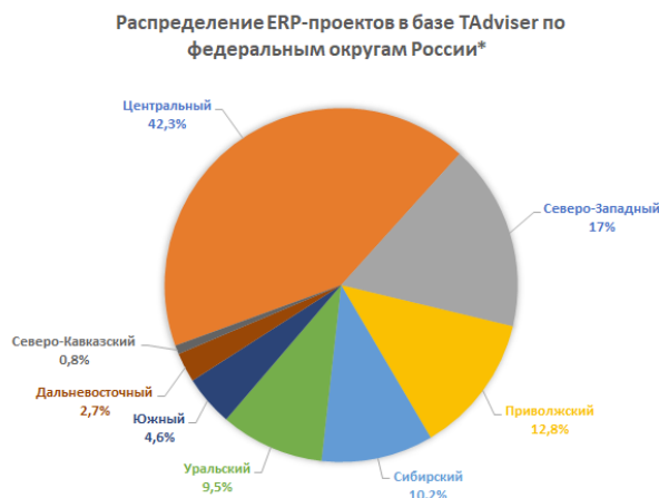
Рис. 2 – Распределение ERP – проектов по федеральным округам РФ период 2007-2019гг.

Доля представленных систем не имеет сильных «скачков» на IT-рынке в 2016-2018 гг. «SAP» и «1С» занимают ведущие позиции по использованию ERP-систем в России. По объёмам выручки фирма «1С» по-прежнему проигрывает зарубежному «SAP», хотя и демонстрирует лучшую динамику роста финансовых показателей.