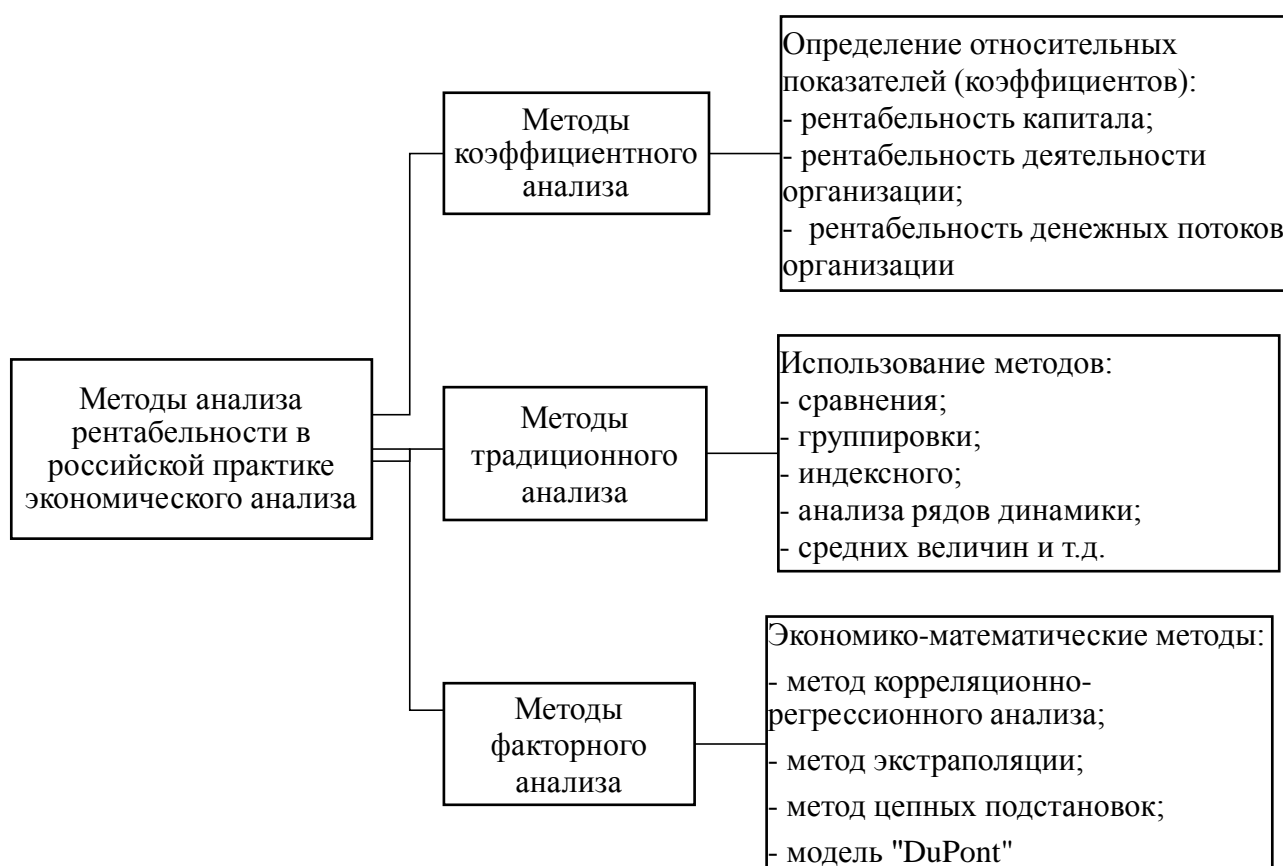
Рис. 1 - Классификация методов анализа рентабельности 1

На рисунке 1 представлена классификация методов анализа рентабельности хозяйственной деятельности организации.