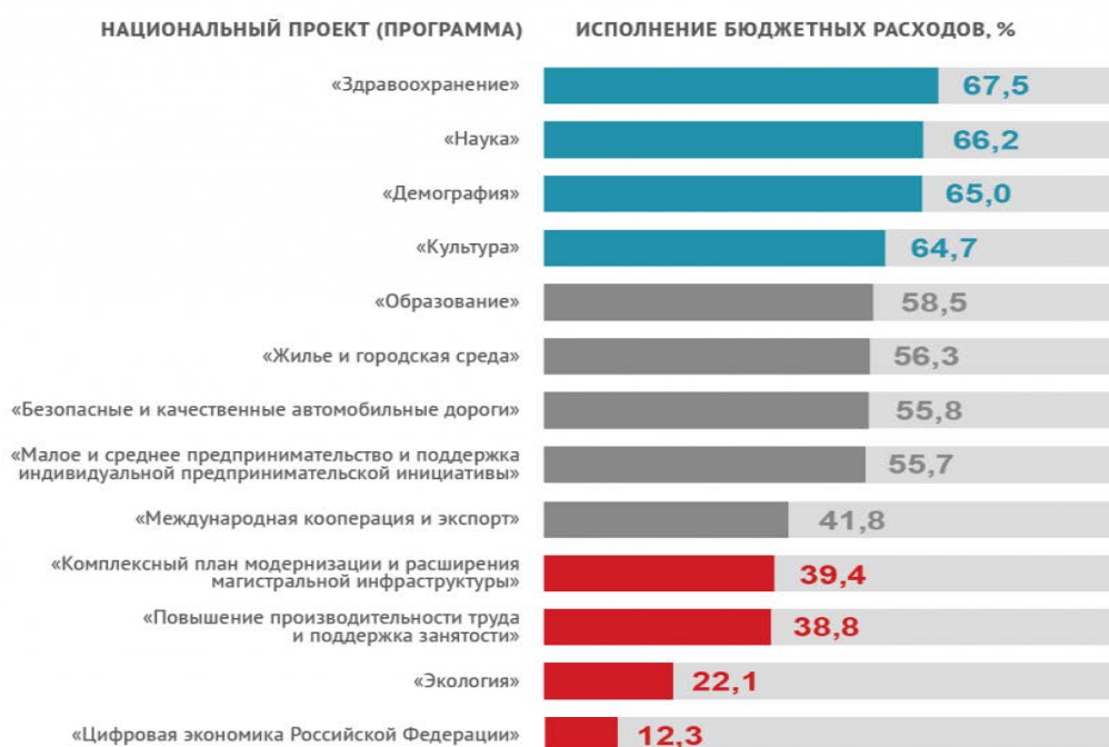
Рисунок 2 Уровень исполнения расходов на национальные проекты, 2019 г. [8]

Сфера здравоохранения за прошедший период от увеличения общего объема расходов ничего практически не получила. Государственное финансирование медицины колебалось вокруг уровня 3-3,5% ВВП, что вдвое ниже, чем в среднем по ОЭСР. Проекты Минфина также не предусматривают изменение ситуации в лучшую сторону – в 2020 г. расходы на здравоохранение планируются на уровне 3,2%, а к 2021 снизятся еще до 3,1% ВВП.