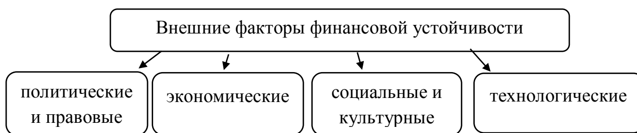
Рис.2 – Внешние факторы финансовой устойчивости

Рассмотрим основные группы внешних факторов, влияющих на финансовую устойчивость. (рис.2).