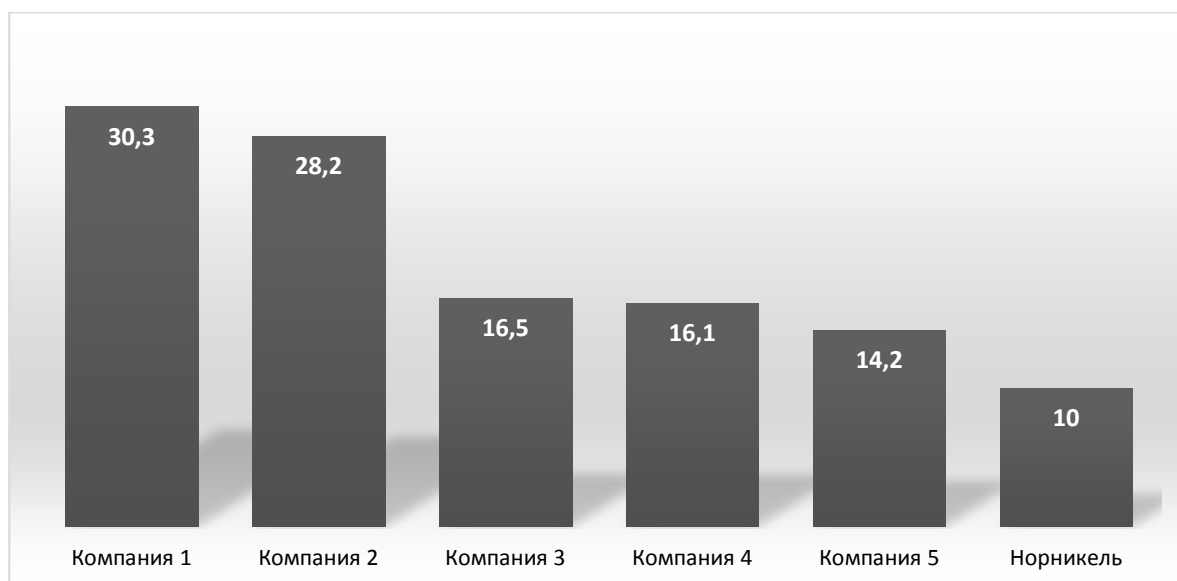
Рис. 1 – CO 2

Предполагается, что Норникель сохранит один из самых низких показателей выбросов CO 2 по сравнению с другими компаниями отрасли (рис. 1).