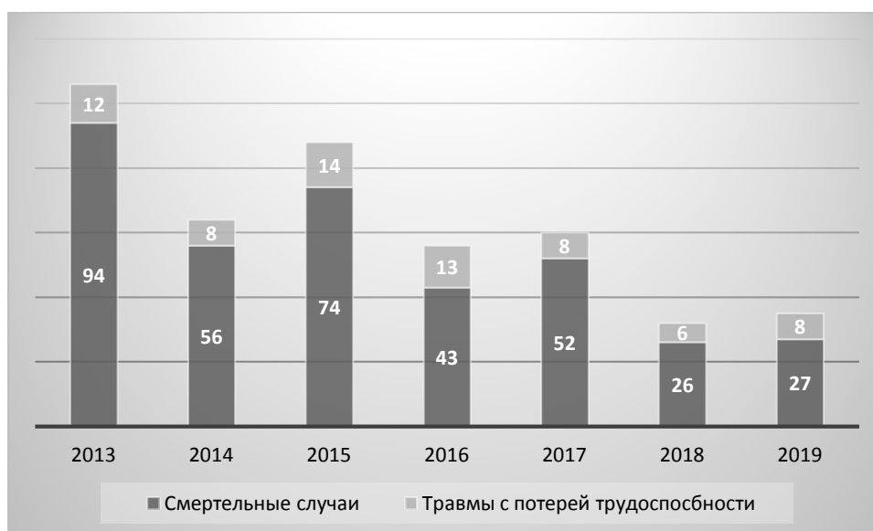
Рис. 4 – Несчастные случаи

Количество несчастных случаев уменьшилось, так как проводились регулярные внутренние аудиты Системы управления промышленной безопасностью и охраной труда (66 проверок в 2019 г.), а также были введены кардинальные правила безопасности в 2014 г. (105 работников уволены в 2019 г.) (рис. 4).