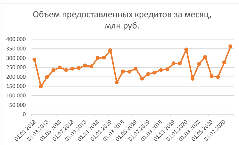
Рис. 2 - Объем предоставленных ипотечных кредитов за месяц, млн.руб [составлено автором по материалам Банка России]

На рисунке 2 представлена статистическая информация по объемам предоставленных кредитов с начала 2018 года по август 2020 года.