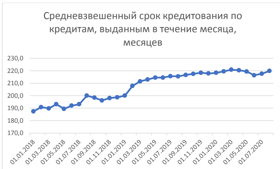
Рис. 3 – Средневзвешенный срок ипотечного кредитования, месяцев [составлено автором по материалам Банка России]

Анализируя данные ЦБ РФ по итогам июля можно сказать, что наблюдалась наименьшая средневзвешенная ставка по ипотеке за период статистических исследований в данной области -7,28% (рисунок 4):