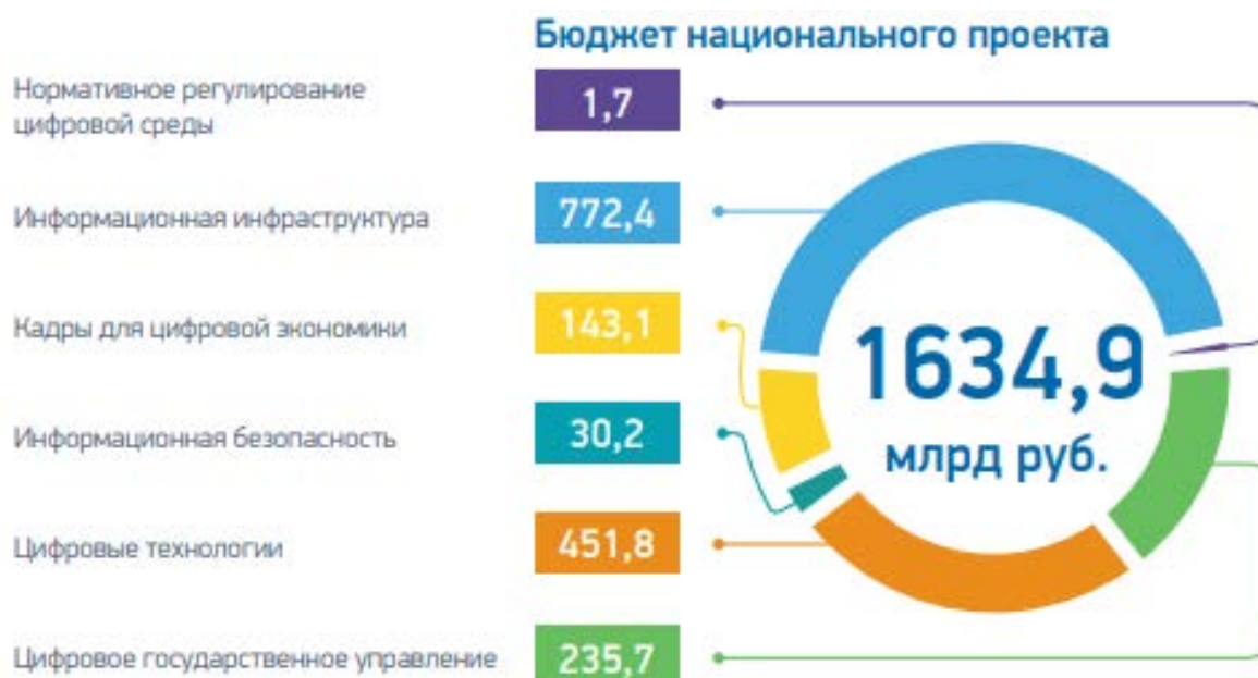
Рис. 1 – Федеральные проекты, входящие в реализацию государственной программы «Цифровая экономика» и размер их финансового бюджета [1].

Общая структура национальных проектов и бюджета их государственного финансирования при реализации программы «Цифровая экономика» изображены на рисунке 1.