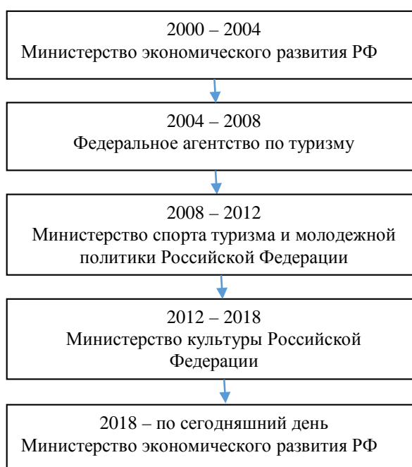
Рис. 3 - Функциональная трансформация органов исполнительной власти с 2000 года в сфере туризма на территории Российской Федерации (составлено автором на основе источника 4)

Рассмотрим функциональную трансформацию органов исполнительной власти с 2000 года в сфере туризма на территории Российской Федерации: