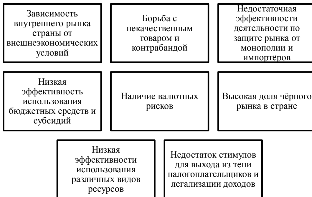
Рис. 1 – Проблемы экономической безопасности.: