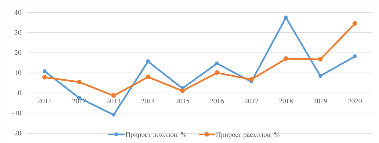
Рис. 1. Прирост показателей доходов и расходов бюджета Республики Карелия за период 2010-2020 гг.

Как видно по данным таблицы 1 за исследуемый период преобладающим состоянием был дефицит республиканского бюджета. Наиболее существенный прирост дефицита пришелся на 2012 год: размер доходной части в 2012 и 2013 году уменьшался на 2,4% и 10,8%. Снижение доходов объясняется введением в налоговое законодательство института консолидированной группы налогоплательщиков, в результате которого карельский бюджет недополучил практически 10% доходов. При этом расходы имели слегка иную тенденцию – увеличение на 5,5% в 2012 году, и уменьшение в 2013 году на 1,3%. (Рисунок 1). Такая разница привела к наибольшему в данном периоде дефициту бюджета в 2013 году – порядка 4,7 миллиарда рублей. Нарастивание расходов бюджета связано с реализацией майских указов Президента, которые увеличили объемы бюджетных обязательств субъектов Российской Федерации.