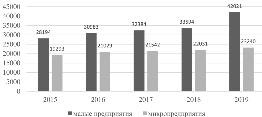
Рис. 5 — Средняя заработная плата работников малых предприятий и микропредприятий в Республике Коми 2015-2019гг (руб.)

В 2020 году пандемия внесла свои коррективы в работу субъектов малого бизнеса. Вообще у субъектов малого бизнеса есть уникальная способность — пробуждаться в периоды экономических спадов, решать многие социальные и экономические проблемы. Но, в данной ситуации, произошло не пробуждение, а угасание малого бизнеса. Согласно онлайн опросу среди субъектов МСП, который проводился в период с конца марта по начало мая 2020 года и был направлен на выявление проблем субъектов малого бизнеса Республики Коми, возникающих в связи с распространением коронавирусной инфекции COVID-19, для включения в пакет мер Правительства Российской Федерации и Правительства Республики Коми по поддержке субъектов малого и среднего предпринимательства в связи с чрезвычайными мерами в экономике, многие предприниматели отметили спад спроса на услуги, резкое сокращение выручки на 40–50%, малому бизнесу не чем было платить заработную плату, налоги, арендные платежи и коммунальные услуги, погашать кредитные обязательства. Малый бизнес, в этот период, исчерпал все свои резервные фонды, начал распродавать имущество и ликвидировать бизнес.