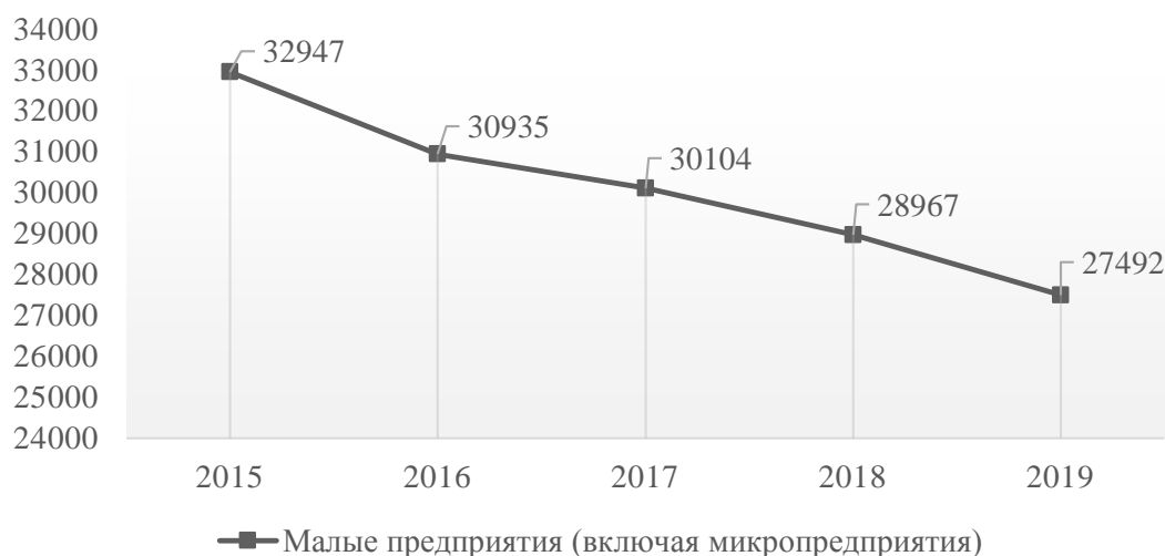
Рис. 2 — Динамика количества малых предприятий (включая микропредприятия) в Республике Коми за период с 2015г. по 2019г.

Количество субъектов малого бизнеса по Республике Коми в рассматриваемом периоде существенно сократилось на 16,56%.