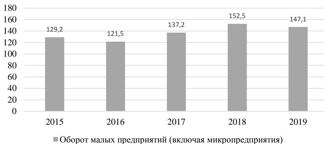
Рис. 4 — Оборот малых предприятий (включая микропредприятия) в Республике Коми 2015-2019гг (млрд. рублей)

Таким образом, стремительное сокращение количества субъектов малого бизнеса и нестабильные обороты малых предприятий Республики Коми, никак не отразились на среднесписочной численности работников и на величине средней заработной платы (рис. 5). Средняя численность работников в рассматриваемом периоде увеличилась, это весомый показатель того, что действующие субъекты малого бизнеса в Республике Коми укрепили свои позиции в системе экономических отношений.