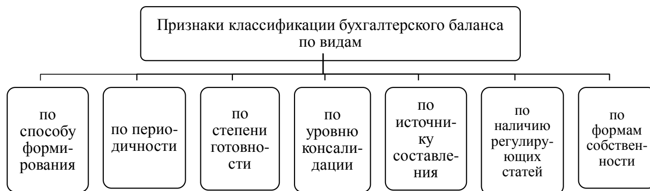
Рис. 1- Признаки классификации бухгалтерского баланса по видам (разработка авторов)

Далее проанализирует по отдельности виды бухгалтерского баланса по признакам классификации.