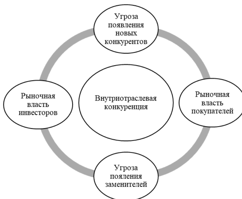
Рис. 1 – Основные составляющие модели пяти конкурентных сил Портера

Данная модель имеет следующие составляющие (рис.1) [3]: