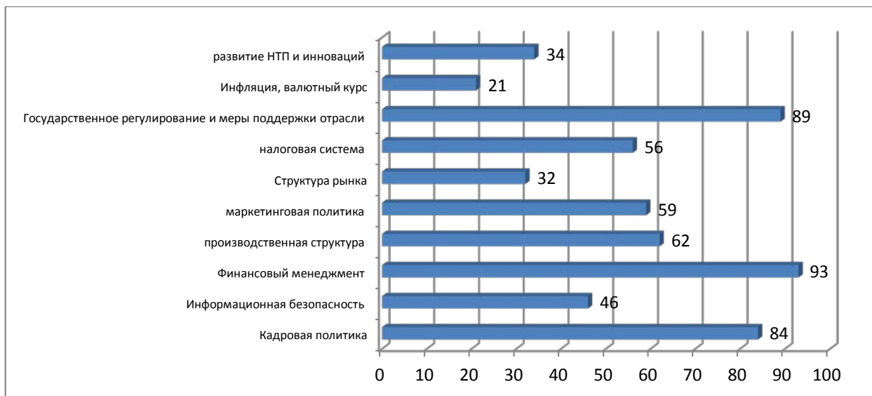
Рис.3. Ранжирование степени важности параметров, используемых в оценке эффективности управления МУП «ЖКХ», баллов