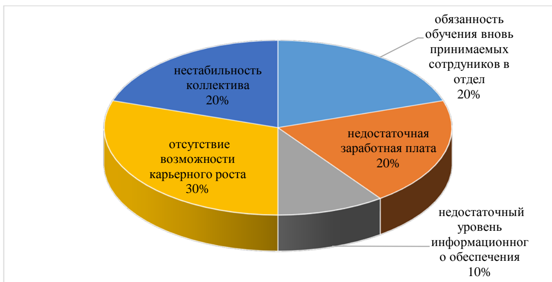
Рис.3. Распределение ответов на второй вопрос «Какие факторы работы в отделе кадров Вас не устраивают?»

Большая часть сотрудников удовлетворена своей должностью, однако 32% опрошенных удовлетворены частично, а 13% - вовсе не удовлетворены. Для определения причин неудовлетворённости работников своим рабочим местом был задан второй вопрос, распределение ответов на который приведено на рис.3.