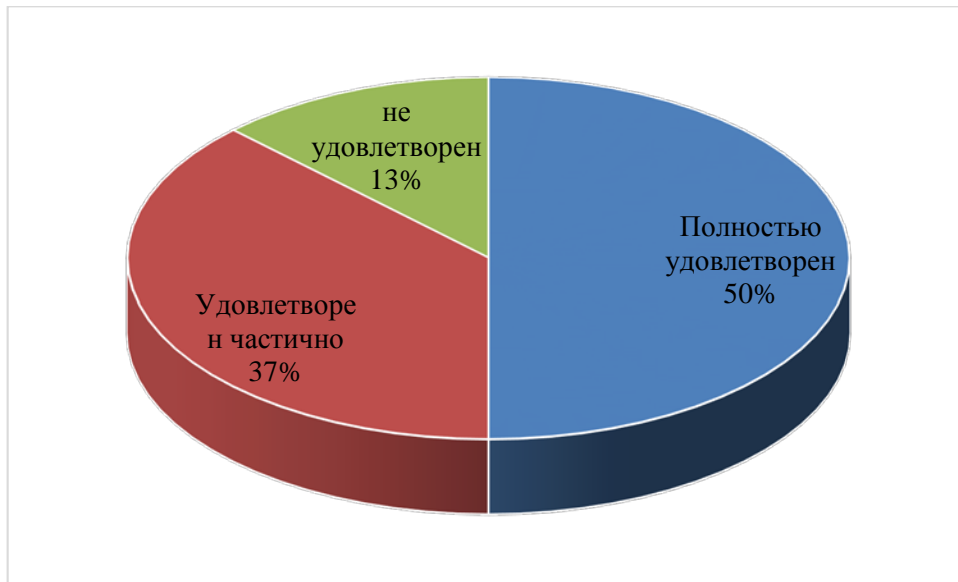
Рис.2. Распределение ответов на первый вопрос 1 «Удовлетворены ли Вы своей должностью?»