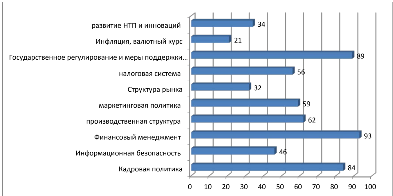
Рис. 1. Ранжирование степени важности параметров, используемых в оценке эффективности управления ООО «Уют», баллов