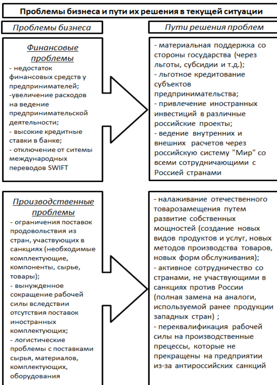
Рис. 1 – Проблемы бизнеса и пути их решения в текущей ситуации