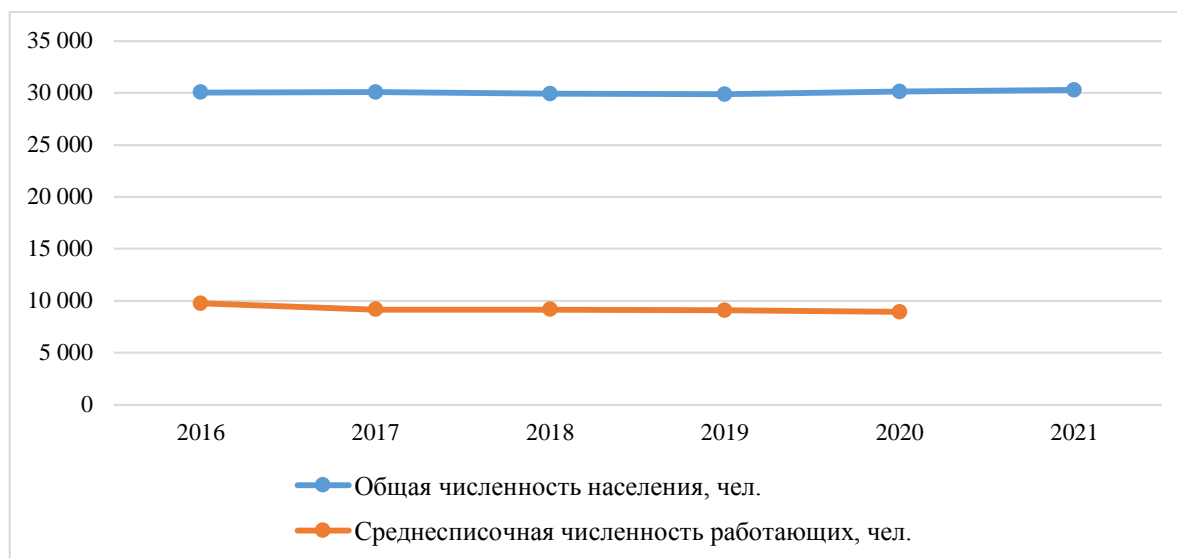
Рис. 2 - Динамика среднесписочной численности рабочих и общей численности населения округа*.