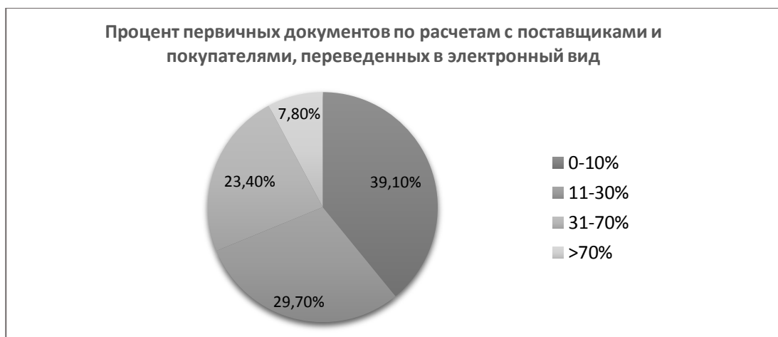
Рис.2 - Процент первичных документов по расчетам с поставщиками и покупателями, переведенных в электронный вид в организациях Кировской области

В результате проведенного опроса получились следующие результаты. В 39,1% компаний Кировской области в электронный вид переведены лишь до 10% первичных документов по расчетам с поставщиками и покупателями, и только в 7,8% предприятий переведены в электронный вид более 70% ПД (рис.2).