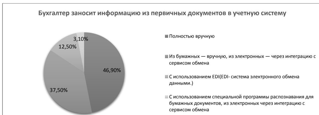
Рис.1 – Уровень использования специальных программ при занесении информации из ПД в учетную систему

Можно сделать вывод, что в Кировской области пока не наблюдается массовый переход на ЭДО, так как многие процессы до сих пор обрабатываются в бумажном виде. Так, в 46,9 % компаний бухгалтер полностью вручную заносит информацию из ПД в учетную систему (рис. 1).