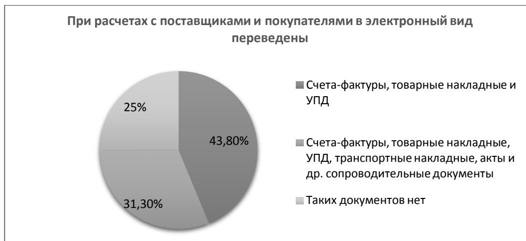
Рис.3 – Виды документов, переведенных в электронный вид при расчетах с поставщиками и покупателями в организациях Кировской области

Опрос также показал, что бизнес отказывается от цифровых решений по нескольким основным причинам (рис.4):