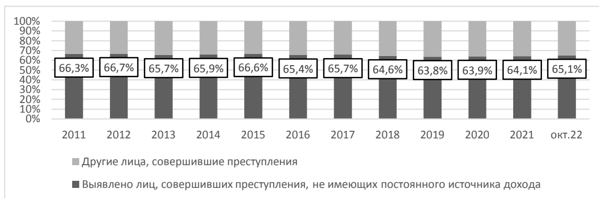
Рисунок 2 – Соотношение выявленных лиц, совершивших преступления по характеру наличия постоянного источника дохода

[10]