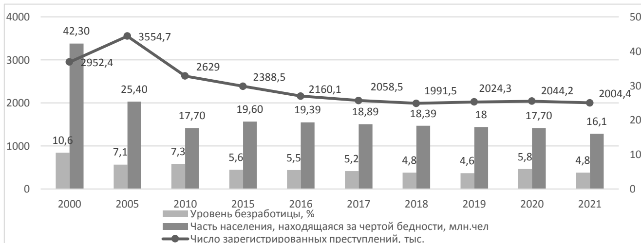
Рисунок 1 - Динамика числа зарегистрированных преступлений в сравнении с социальными показателями

Тот, кто пытался понять природу преступности, наверняка слышал фразу “Бедность - мать преступления”. Эти слова хорошо демонстрирует динамика уровня преступности. Как правило, увеличение числа безработных сопровождается неизменным увеличением доли бедного населения и уровня преступности. (рис. 1)