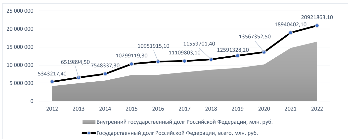
Рисунок 4 – Динамика величины государственного долга Российской Федерации

Действительно, угроза государственного долга экономической безопасности Российской Федерации остаётся актуальной. Так исследование динамики государственного долга показывает, что увеличение государственной задолженности Российской Федерации происходит ежегодно. (рис. 4)