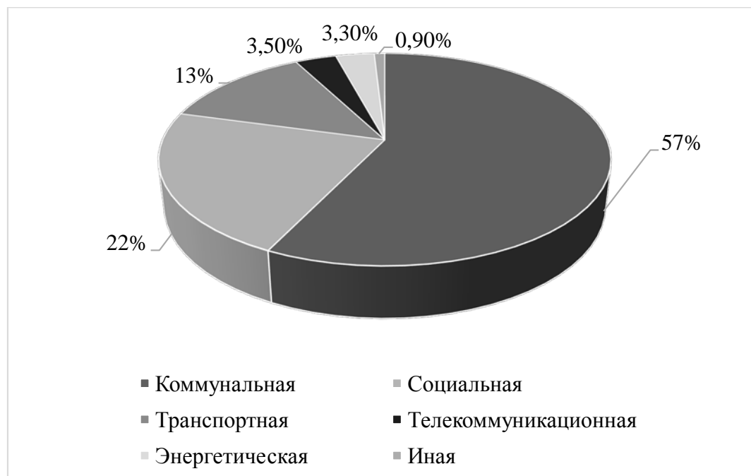
Рис. 2. – Распределение концессионных соглашений по сферам и отраслям*

*составлено на основе данных платформы «РОСИНФРА» [5]