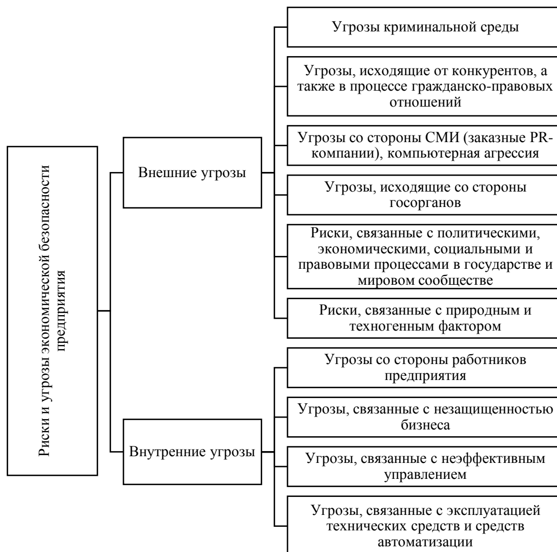
Рис. 1 - Угрозы экономической безопасности предприятия [3]

Все угрозы классифицируются на внутренние и внешние. При их возникновении, в первую очередь, следует обращать внимание на такие признаки как: реальность, источник, причина, масштаб и способность предприятия своевременно предотвращать угрозы.