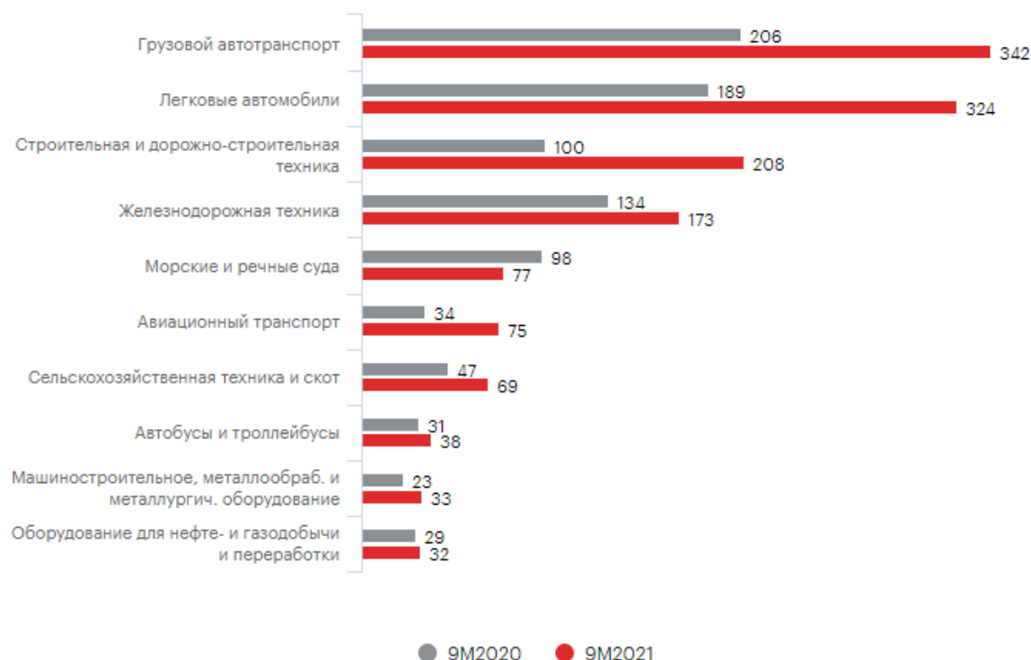
Рис. 3 – ТОП-10 сегментов лизинга в новом бизнесе

В сегменте железнодорожной техники также наблюдалась тенденция на увеличение. Объем бизнеса в сегменте строительной техники вырос на 107%. Данный рост во многом обусловлен вводимыми мерами государственной поддержки по выдаче субсидий субъектам лизинга на приобретение специальной строительной техники и оборудования. Также на рост было оказало влияние за счет реализации крупных проектов в сфере инфраструктуры. Наиболее масштабные по объемам нового бизнеса за 9 месяцев 2021 года сегменты рынка лизинга представлены на рис. 3 [6].