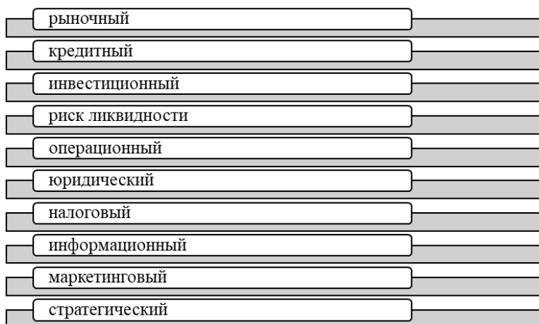
Рисунок 1 - Классификации рисков [2]

Хотелось бы выделить стратегический риск, так как это риск возникновения убытков в результате ошибок в принятии решений, касающихся стратегии деятельности и развития организации, другими словами, стратегическое управление.