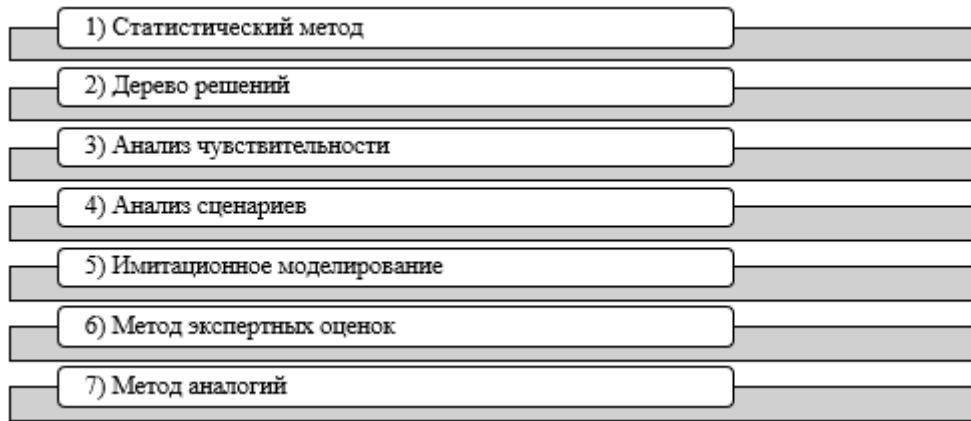
Рисунок 3 - Количественные методы оценки риска [6]

Основные количественные методы для оценки риска представлены на рисунке 3.