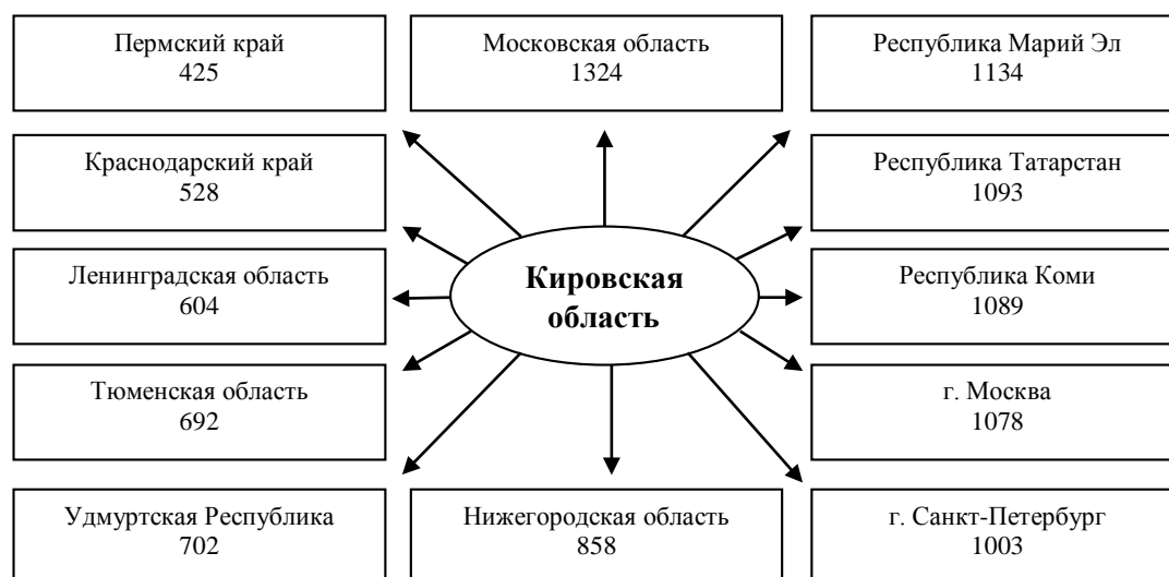
Рисунок 2 – Схема основных миграционных потоков межрегиональной миграции за 2020 год (авторская разработка)

Кировская область более двух десятилетий является «регионом-донором» для территорий Российской Федерации. Так, например, в 2020 году наиболее привлекательными для выбывших из региона оказалась Московская и Нижегородская области, города Москва и Санкт-Петербург, а также республика Марий Эл, Татарстан и Коми (рисунок 2, на рисунке указано количество выбывших из Кировской области человек).