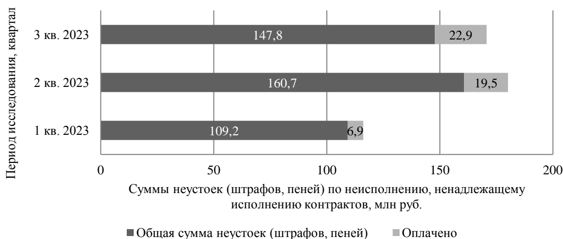
Рис. 2 - Динамика начисленных неустоек (штрафов, пеней) по государственным контрактам за три квартала 2023 года, млн руб.[7]

Выявленные контрактные риски в сфере государственных закупок в период 2019 – 2023 гг., в первую очередь, опираются на добросовестность и исполнение всех обязанностей по контракту всех сторон. Большая часть рисков имеет как экономическую, так и правовую природу, что, несомненно, увеличивает вероятность их возникновения, сложность выявления, обоснование их управляемости контролирующими органами [8].