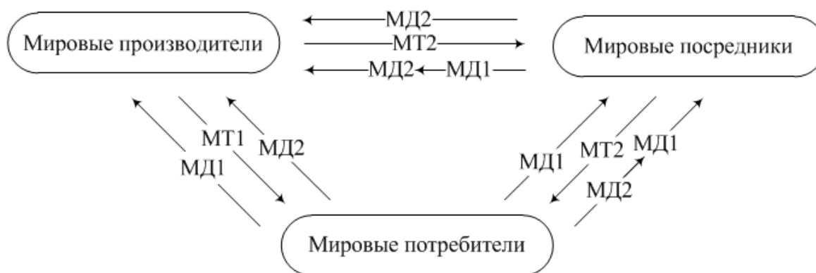
Рис. 1 – Схема существующей мировой экономической системы

Примечание – Собственная разработка автора