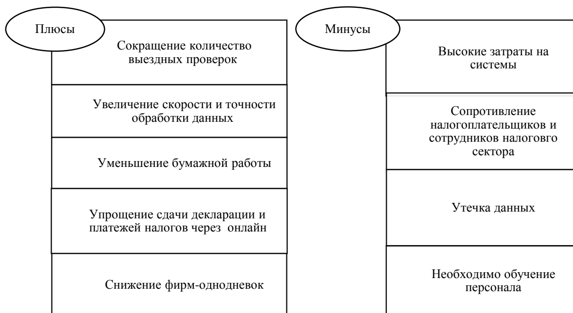
Рис. 3 Преимущества и недостатки цифровизации налогового администрирования (составлено авторами).

Рассмотрим преимущества и недостатки цифровизации налогового администрирования в Российской Федерации (рисунок 3).