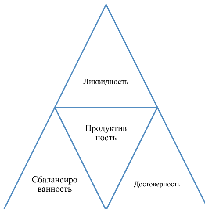
Рисунок 1 - Принципы эффективного управления денежными потоками