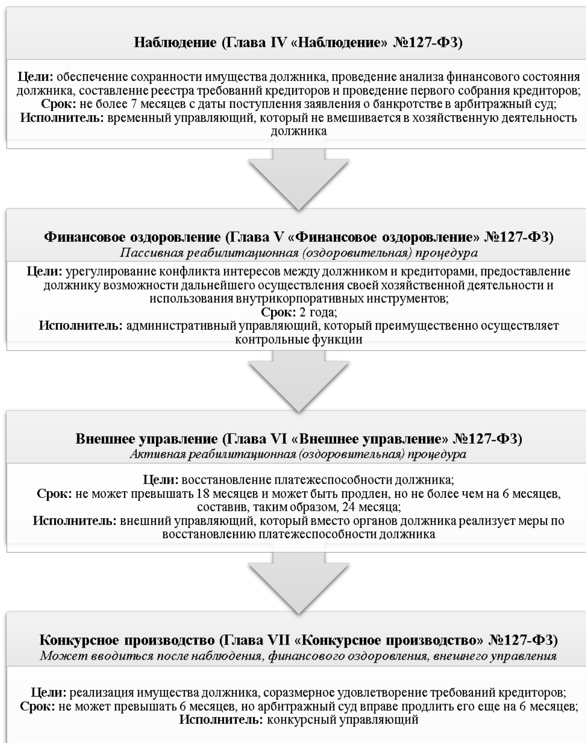
Рис. 3 – Характеристика основных стадий процедуры банкротства

Напротив, когда компании удастся реализовать поставленные цели на той или иной стадии, она продолжает свое функционирование в прежнем режиме.