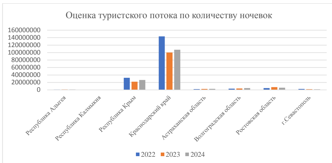
Рисунок 2- Гистограмма туристского потока 2022-2024гг.