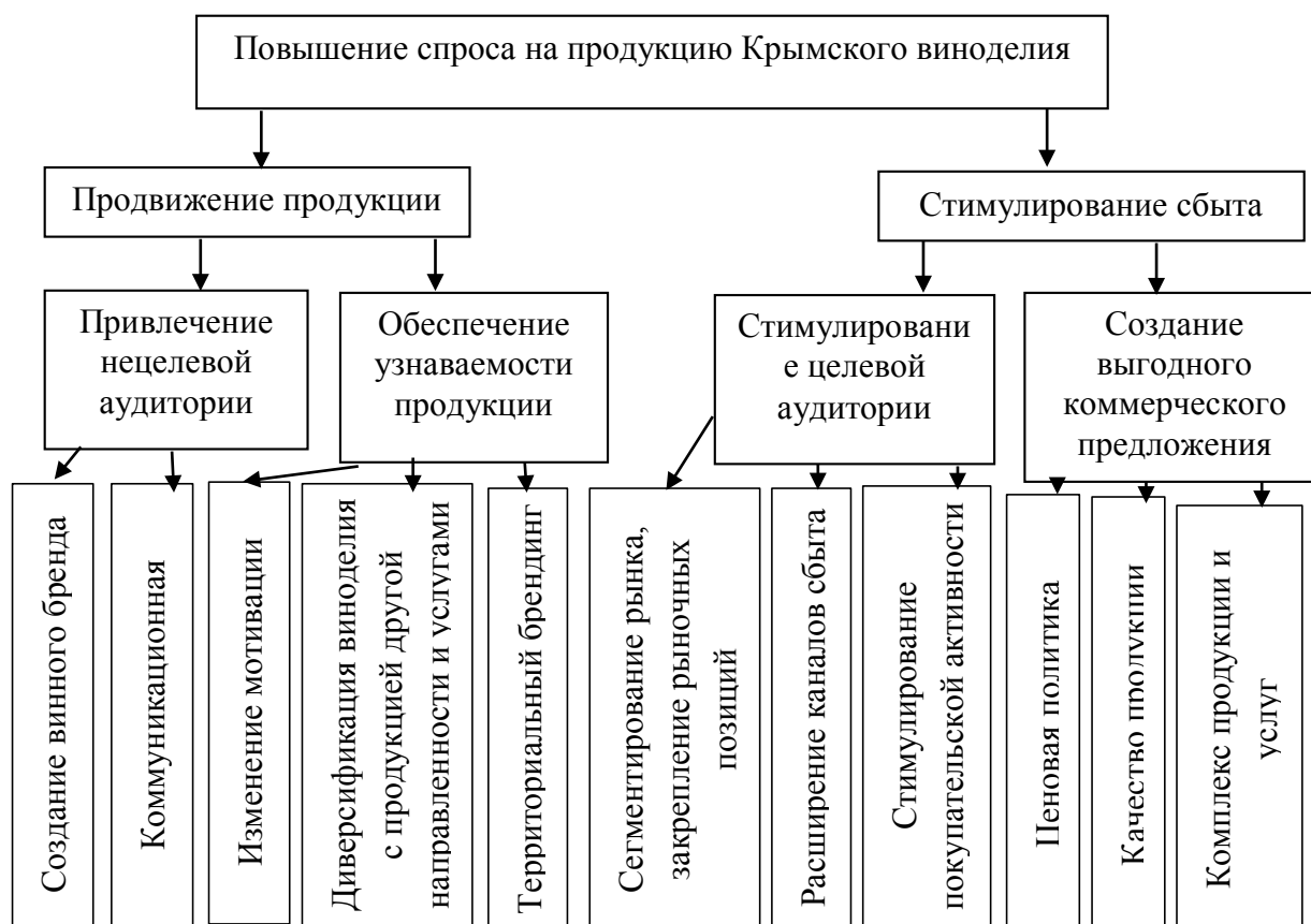
Рисунок 3 – Пути повышения спроса на продукцию Крымского виноделия

В результате введения санкций на импорт вин из стран ЕС изменилось соотношение доли крымских вин и импорта с 2/3 до 81% крымских (произведённых из местного винограда и импортных виноматериалов). Крымские производители далеко не в полной мере используют весь комплекс маркетинга. Продукция Крымского виноделия нуждается в серьезной политике её продвижения и брэндинге. Пути повышения спроса на продукцию Крымского виноделия представлены на рисунке 3.