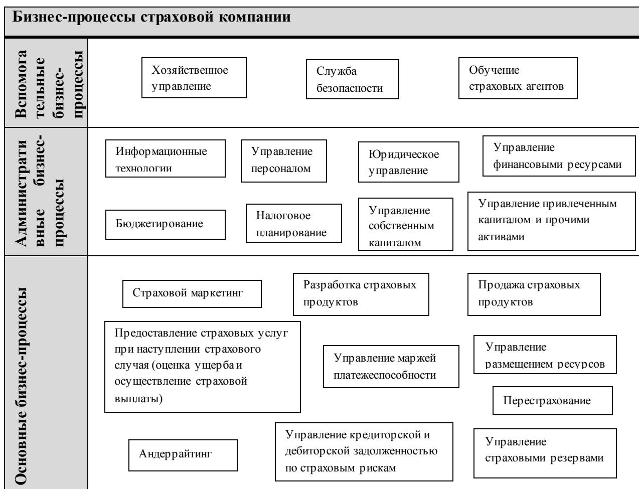
Рисунок 3. Группы бизнес-процессов страховой компании.

«Бизнес-процессы» страховой компании отражены на рисунке 3.