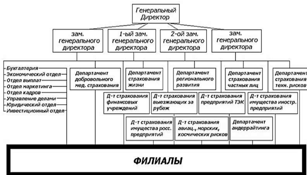
Рисунок 2. Организационная структура Центрального офиса ПАО СК «Росгосстрах»

Сфера интересов «Организация» описывает структуру компании. Центральный офис ПАО СК «Росгосстрах» состоит из 8 отделов и 12 департаментов (рис. 2). Все отделы имеют штат сотрудников и подчиняются начальнику своего отдела, а так же управляющему отделением. Центральный офис Компании осуществляет административное и методическое руководство региональными подразделениями.