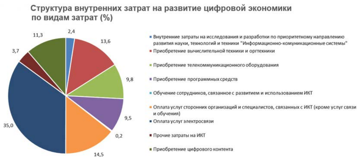
Рисунок 2. Структура внутренних затрат на развитие цифровой экономики по видам затрат [2]

технологии, предпочитая их национальным разработкам. А это, в свою очередь, провоцирует рост рисков зависимости.