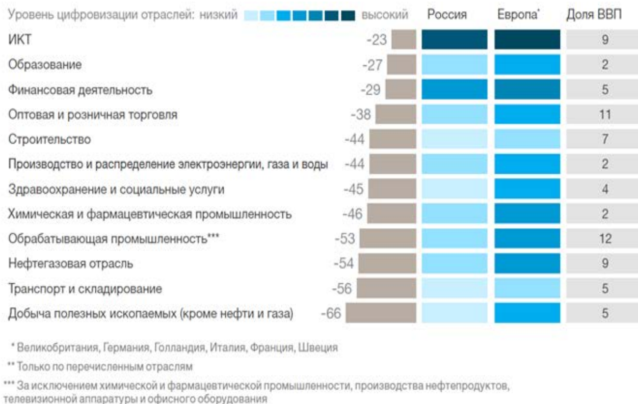
Рисунок 1. Уровень цифровизации отраслей Российской Федерации [2]

Тем не менее, для справедливости отметим, что по некоторым показателям по уровню цифровизации отдельные отрасли в России приближаются к мировым. К их числу можно отнести ИКТ, образование, и, что важно в контексте данной статьи — финансы.