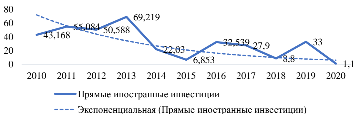
Рис. 1. Прямые иностранные инвестиции в России в период 2010-2020 гг., в млрд долларов США

Тенденция снижения экономической эффективности наблюдается практически во всех сферах деятельности. Индикатором экономической стабильности выступает способность привлекать инвестиции и доверие иностранных инвесторов. На рисунке можно проанализировать динамику прямых иностранных инвестиций в Россию за последние года.