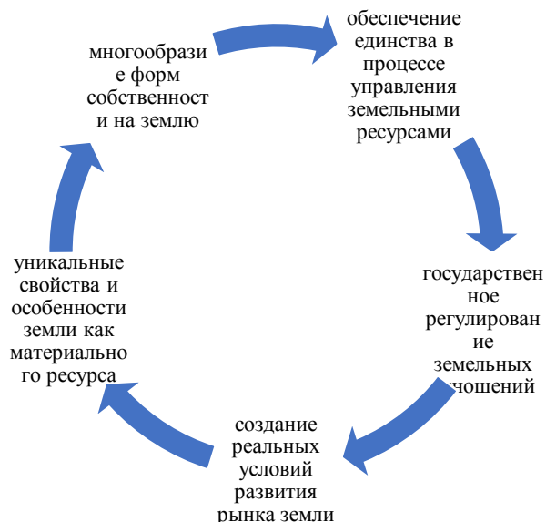
Рисунок 2-Основные принципы развития государственной политики управления земельными ресурсами 2

Рассматривая эффективное управление организационно-экономическим механизмом воспроизводства земельных ресурсов, следует отметить основные его составляющие в части организационного сектора: как семенной материал и удобрения; сельскохозяйственное машиностроение и техника; инновационные агротехнологии обработки почвы и структура севооборотов; биологизация и др. (рис.3)