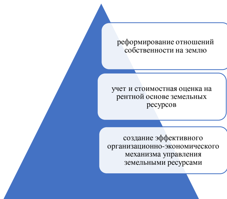
Рисунок 1- Система управления земельными ресурсами на федеральном и региональном уровне 1

Земельные ресурсы имеют три фундаментальные характеристики, устанавливающими их главенствование: жизнеобеспечение как экосистема; основного фактора производства; земельно-имущественные отношения. Приоритетом государственной политики в сфере управления земельными ресурсами в Российской Федерации и регионах является обеспечение условий для эффективного их использования, развитие земельного рынка в интересах удовлетворения социальных потребностей[1].