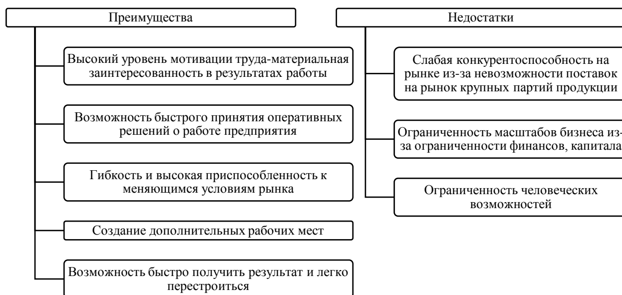
Рисунок 2 – Преимущества и недостатки субъектов малого предпринимательства

В целом, описав особенности, можно сформулировать ключевые преимущества и недостатки, выделяющиеся у субъектов малого предпринимательства на современном этапе (рисунок 2).